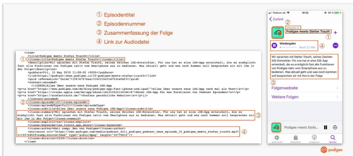
Abbildung 3 Erklärung RSS-Feed 35

Mithilfe eines sogenannten Podcatcher, ist es möglich, diesen RSS-Feed zu abonnieren. Der Podcatcher, der in den meisten Fällen eine App auf dem Smartphone darstellt, verarbeitet die maschinenlesbare Datei in eine übersichtliche Darstellung des Podcasts und seiner einzelnen Episoden. 36 Das Abonnieren eines Podcasts bedeutet im Wesentlichen, den RSS-Feed des Podcasts mit einer Anwendung zu abonnieren, die automatisch die neuesten Mediendateien herunterlädt, sobald sie veröffentlicht werden. 37 Die meisten Podcasts können jedoch auch direkt über den Webbrowser auf den Websites der Anbieter ausgewählt und angehört werden. In diesem Fall müssen die Nutzer jedoch in dem Moment, in dem sie den Podcast konsumieren möchten, online sein und können die neuesten Episoden nicht automatisch offline hören. 38