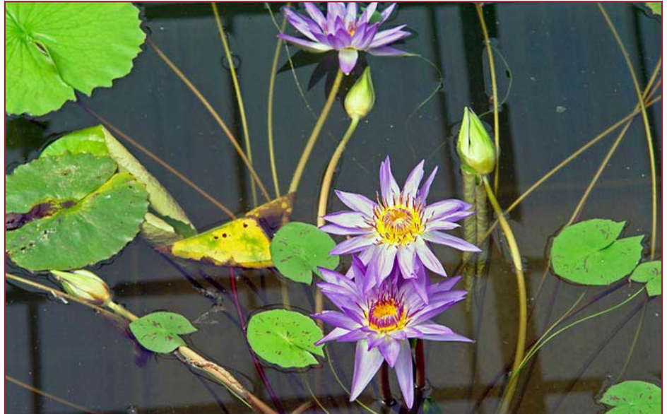
Damit Pflanzen es in Gewächshäusern warm haben, gibt es die Norm DIN EN 12669, die die Anforderungen an gasbefeuerte Heißluftgebläse in Gewächshäusern beschreibt.

Wie groß darf ein Nanopartikel sein, um diesen Namen noch zu verdienen? Und wie misst man diese Größe überhaupt? Nimmt man den Durchmesser, den Umfang oder das Volumen? Auch über das Messverfahren selbst sollte Einigkeit bestehen: Wer nach der einen Methode misst, kommt eventuell zu ganz anderen Ergebnissen als jemand, der ein anderes Verfahren einsetzt – diese Unterschiede dürfen nicht dadurch verwischt werden, dass für beide Resultate die gleichen Begriffe oder Kriterien verwendet werden. Um auf neuen Technologiefeldern zusammenzuarbeiten, müssen Forscher also zunächst einmal wissen, wovon sie reden. Gegenwärtig erfolgt die Verständigung in der wissenschaftlichen Community vorwiegend über Publikationen und den persönlichen Austausch, beispielsweise auf Konferenzen. Die Standardisierung und die Veröffentlichung der entsprechenden Dokumente stellen hier eine weitere Option dar. Für die Nanotechnologie wurde inzwischen – nachdem in diesem Bereich seit Jahren intensiv geforscht wird – im Jahr 2005 in Großbritannien ein Terminologiestandard veröffentlicht.