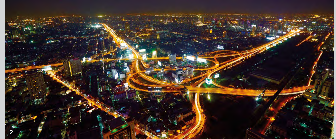
2 Die Komplexität unserer Städte nimmt zu: eine Nachtaufnahme von Bangkok.

nischen Systemen zu tun. So hängt beispielsweise die Resilienz des IT-Systems eines Unternehmens nicht nur von der eingesetzten Hard- und Software, sondern mindestens in gleichem Maße von den Kompetenzen der Mitarbeiter in deren Handhabung ab. Entsprechend erfordert die Entwicklung von ganzheitlichen Resilienzstrategien eine integrierte Betrachtungsweise.