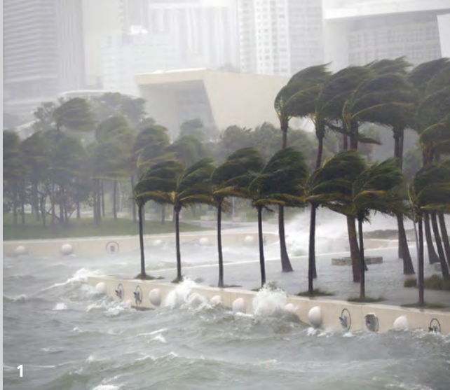
1 Naturkatastrophen wie Hurricane Irma verdeutlichen, wie wichtig resiliente Infrastrukturen sind.