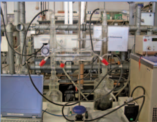
Versuchsaufbau im Labormaßstab (Batch-Betrieb)

Kenntnisse zum Langzeitverhalten bzw. zur Prozessstabilität bei hohen Raum-Zeit-Ausbeuten im kontinuierlichen realen Betrieb sind bislang jedoch nur unzureichend bekannt.