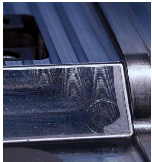
Technikumswerkzeug mit ReleasePLAS® - Trennschicht