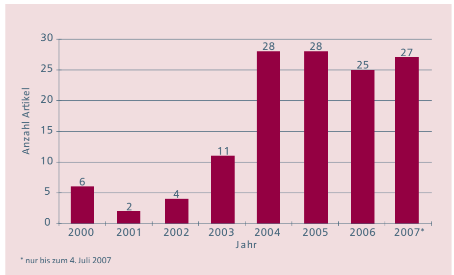
ARTIKEL MIT MEHR ALS 700 WÖRTERN ÜBER UBIQUITÄRES COMPUTING IN AUSGEWÄHLTEN ZEITUNGEN UND ZEITSCHRIFTEN

Quelle: Genios Datenbank, Fraunhofer-ISI