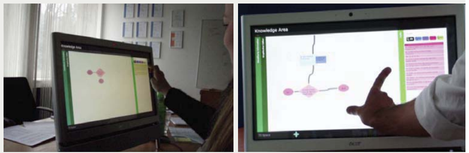
Abb. 4. Interaktion mit dem Multi-Touch-Prototyp, z. B. Vergrößern des Bildschirminhalts mit „spread to enlarge“ (rechts)

Dieser Prototyp wurde in einer Feldstudie mit der Endbenutzergruppe evaluiert (mehr dazu im nächsten Kapitel „Evaluationsdesign“). Aufgrund des vielversprechenden und positiven Feedbacks der Autoren während der ersten Evaluierung wurde beschlossen, den Prototyp weiterzuentwickeln. Diese Weiterentwicklung sollte zum einen die Behebung von Störungen umfassen, zum anderen sollten diejenigen Patterns ergänzt werden, die in der ersten Version nicht oder nur modifiziert umgesetzt werden konnten. Bezogen auf die modifizierte Geste zum Verbinden von Prozessbausteinen zeigten die Evaluationsergebnisse, dass die Benutzer mit dieser Geste Schwierigkeiten hatten. Zum einen, weil es beim Ausführen häufig zu Kollisionen mit anderen Elementen kam, zum